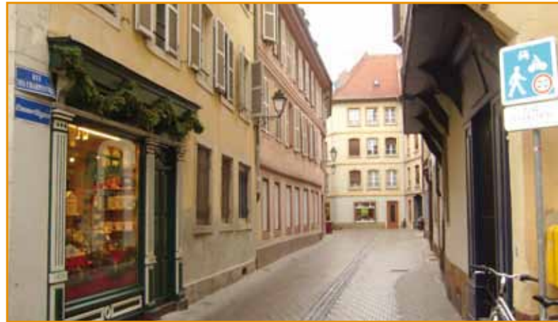
Zone de rencontre