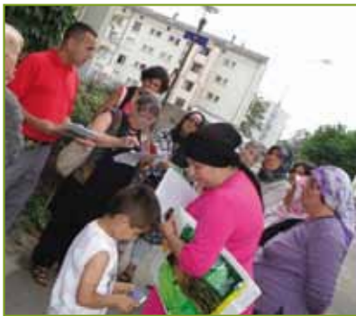
Sensibilisation au tri des déchets et à la propreté

Née en 1988, et s'inscrivant dans la continuité du travail mené par le Collectif des Associations du Neuhof, l' Agate Neuhof s'adresse à tous indistinctement, enfants, jeunes, adultes, de toutes origines, qui se trouvent réunis sur les mêmes objectifs et s'impliquent ensemble sur les mêmes actions.