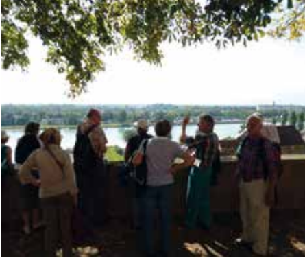
Colmar-Fribourg : à quand la reconstruction du pont ferroviaire sur le Rhin ?

Dimanche 7 septembre 2014, par une belle journée estivale, près de 25 participants se retrouvent à Kehl pour prendre le train de 8h04, munis du Baden-Württemberg-Ticket . Ce titre de transport multimodal n'est malheureusement pas utilisable à partir de la gare de Strasbourg, alors que cette facilité existe depuis quelques années pour les deux gares principales de Bâle.