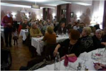
Le repas de la nouvelle année d'ASTUS a réuni plus de 60 de nos adhérents et le res-