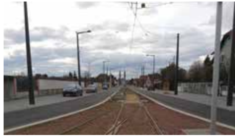
Le 22 avril prochain les rames de tram circuleront sur la nouvelle extension de la ligne

de tram A vers le centre d'Illkirch-Graffenstaden : cette extension et le nouveau terminus de la ligne E à Campus d'Illkirch seront officiellement inaugurés le 30 avril. Parallèlement à ces extensions, des modifications seront apportées à plusieurs lignes de bus vers le sud : les lignes 2, 7, 13, 62, 63, 65 et 66 sont concernées.