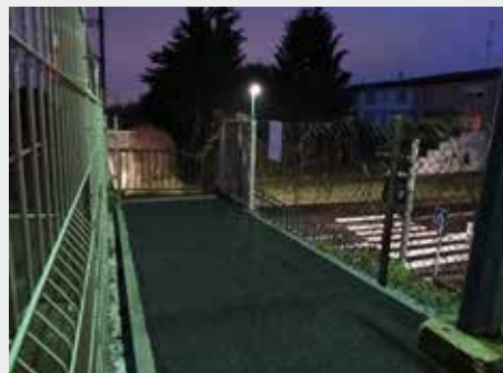
Les travaux de comblement du décrochement au niveau du haut de l'escalier d'accès au quai de Geispolsheim ont fini par être réalisés après de nombreuses demandes d'ASTUS.