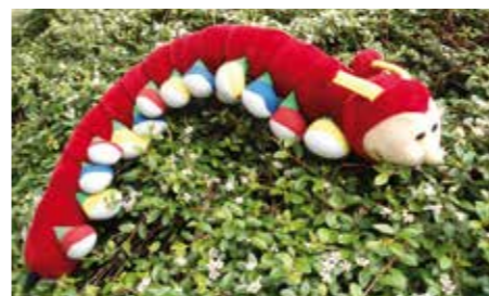
La mascotte d'ASTUS

Pour 2017, est enfin prévue une intégration tarifaire pour les abonnés CTS résidents de l'Eurométropole. Une amorce vers un vrai ticket unique.