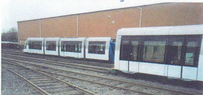
1/2 rame en attente de livraison.