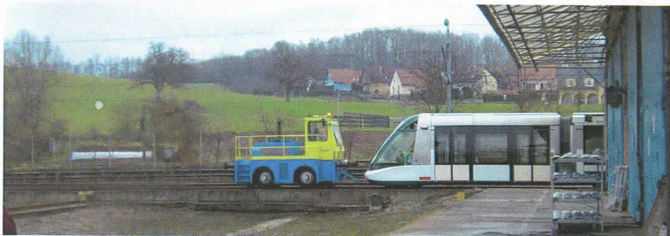
Sortie d'une rame des essais d'étanchéité.