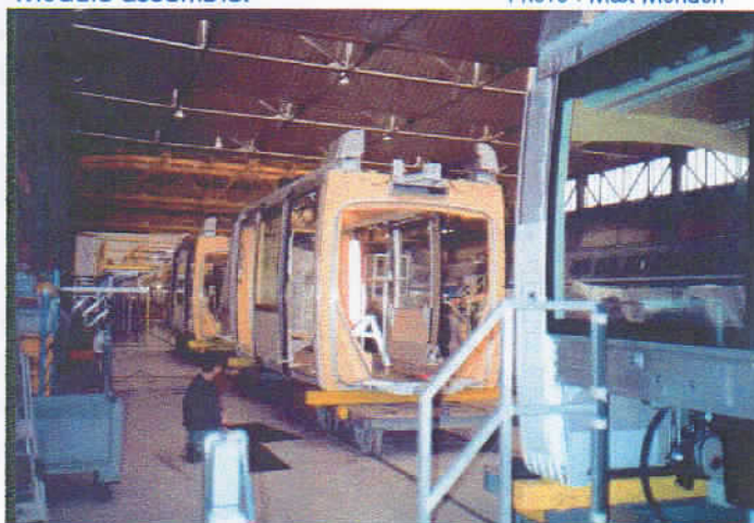
Vue d'ensemble du hall de montage.