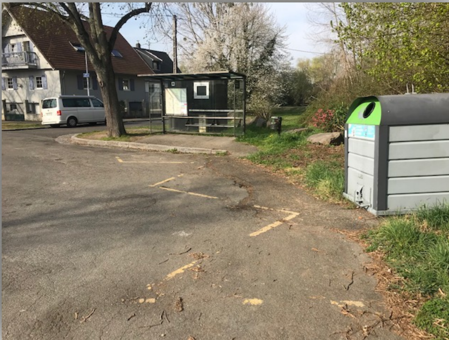
Ligne 30 Arrêt : Robertsau Chasseurs